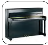
Concerto 114 Negro Pulido

Diseño moderno Mecánica Yamaha Tecnología "Vacuum Shield Mold Process" Barraje reforzado Disponible en Silent Yamaha SH