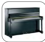
Classic T116 Negro Pulido

Diseño clásico Mecánica Yamaha Tecnología "Vacuum Shield Mold Process" Barraje reforzado Disponible en Silent Yamaha SH