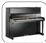
K121CL Negro Pulido

Tradicional 5.511 € PE Silent (SH) 7.571 € PE