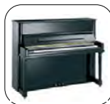
Conservatory Negro Pulido

Diseño clásico y sencillo Mecánica Yamaha Tabla armónica sólida de abeto europeo Tecnología "Vacuum Shield Mold Process" Barraje reforzado Disponible en Silent Yamaha SH