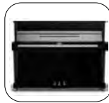
K113 Negro Pulido

Estilo Moderno * (Metales cromados) Diseño de la corona optimizado Puente de madera de arce en tres capas Ruedas traseras y delanteras Disponible en Silent Yamaha SG2