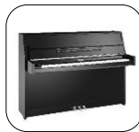
Cambridge 112 Negro Pulido

Tradicional 4.780 € PE Silent (SH) 6.840 € PE