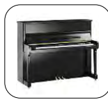
Chopin (Ed. Especial) Negro Pulido