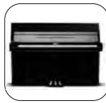
K109 Negro Pulido

Tradicional 3.167 € PEC Silent (SG2) 4.647 € PEC